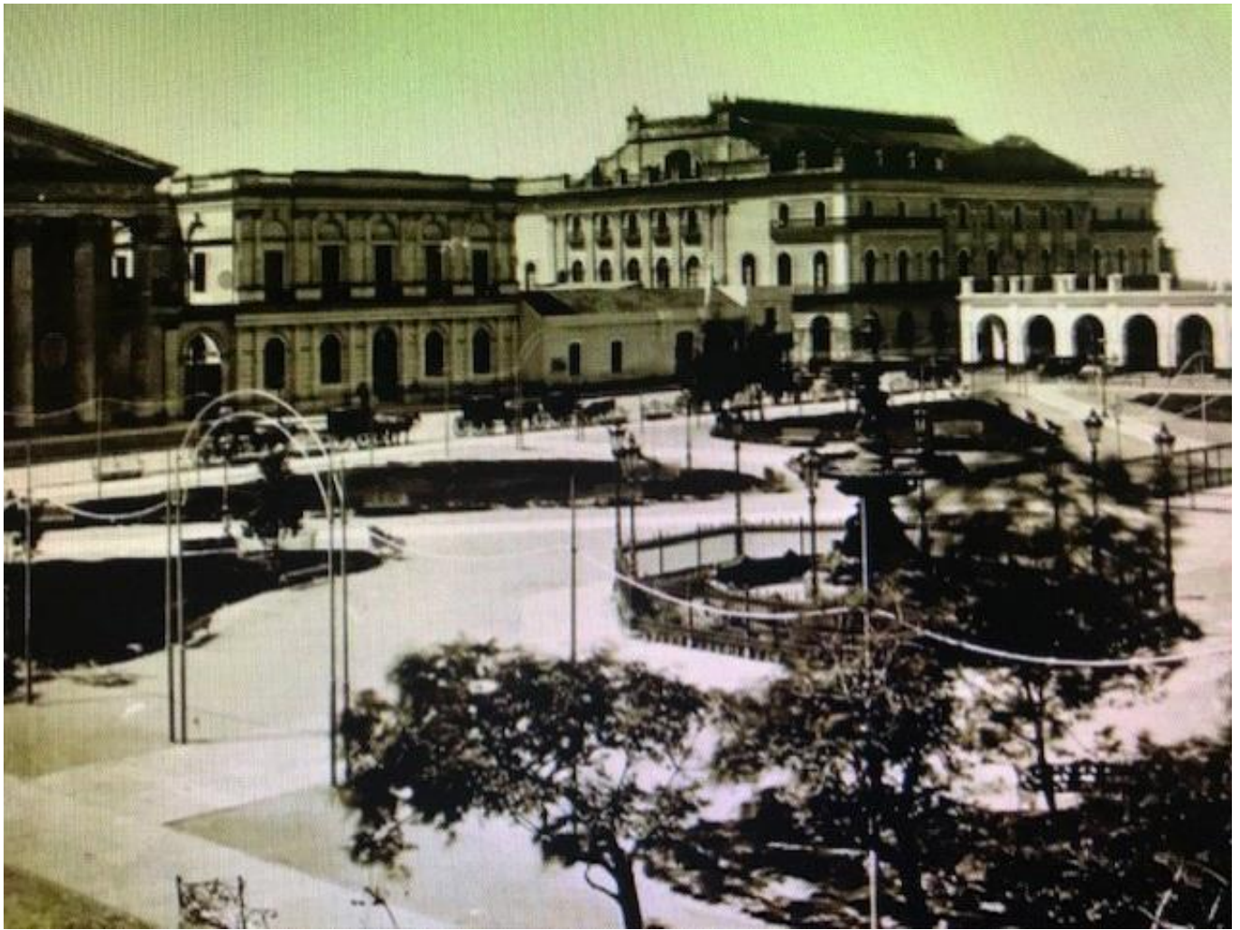
Plaza de la Victoria. Recova y antiguo Teatro Colón c.1880

Hacia 1910, un proyecto del Ing. Adolfo Büttner logró equilibrar las diversas construcciones a través de una envolvente con gestos afrancesados, coronada por mansardas y lucarnas de fuerte impronta en la esquina de Rivadavia y Reconquista. Recurso que, si bien no dejaba de ser una sumatoria de edificios de distinta factura, ayudaba a dar al conjunto una cierta homogeneidad.