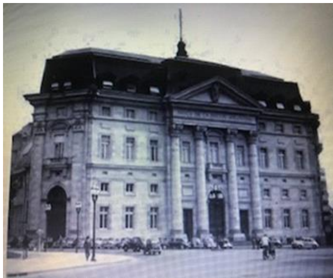
Fachada principal. 1944.