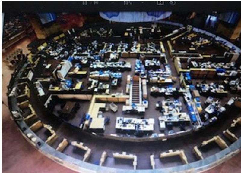
Planta Baja operativa. Buenos Aires. 2016.