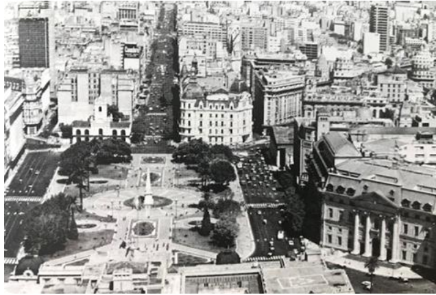
Plaza de Mayo, Avda de Mayo y fachada principal del BNA.