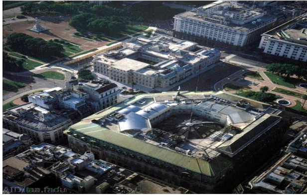
Foto aérea del conjunto