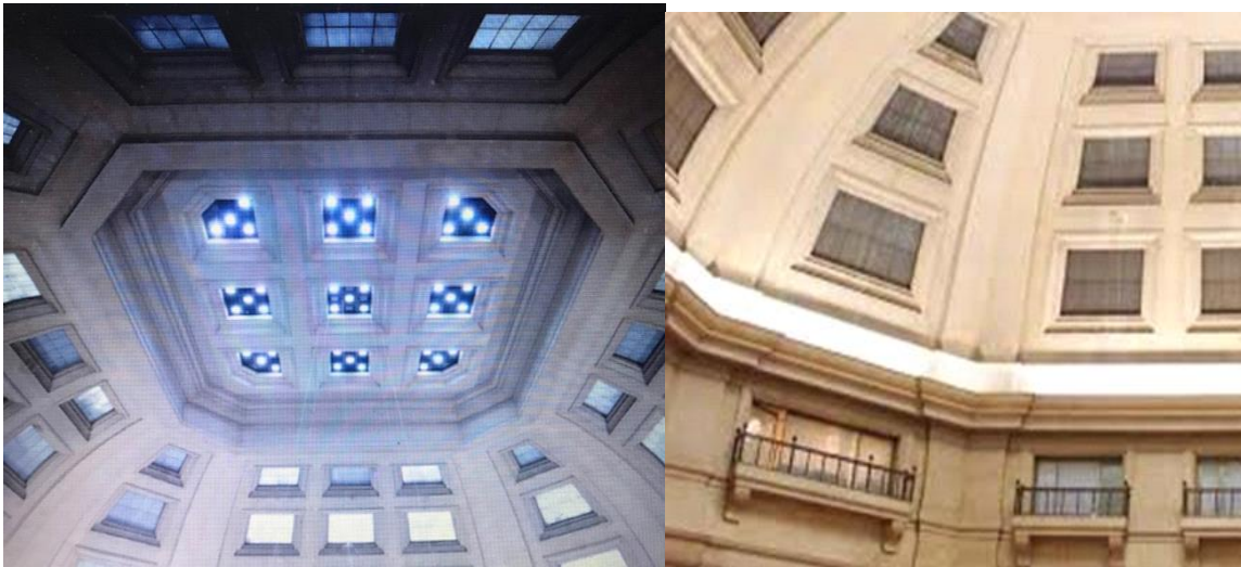
Bóveda del espacio central, Planta Baja 2016.

La bóveda, que cubre el salón público en casi toda su dimensión, resultó ser para su época un alarde tecnológico y una de las más grandes del mundo en su tipo, por su importante diámetro y no estar balanceada con los muros. Como expresó Bustillo en una entrevista “es una bóveda de cáscara, invento alemán, es como la tapa de un frasco, cuando se dilata el hormigón está apoyada sobre carritos de acero que le permiten expandirse y se mueve bastante, de cada lado como unos 15 cm”.