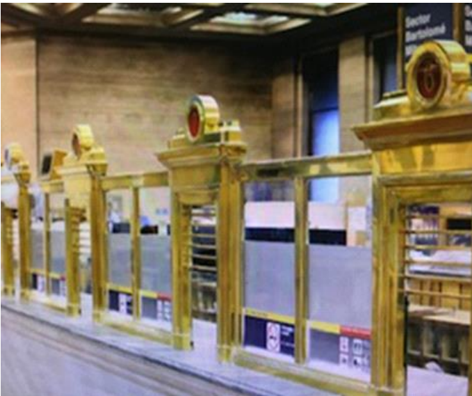
Línea de cajas. Buenos Aires. 2016.