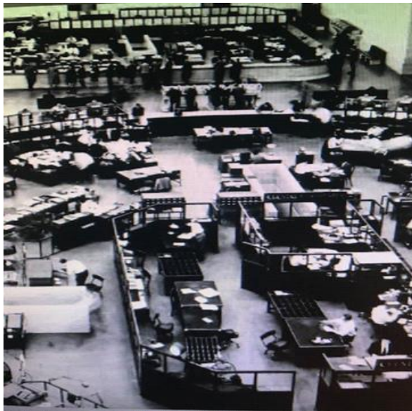
Hall Central c.1960.

En la planta original se puede observar el claro partido de islas o sectores, 4 laterales y una central, rodeadas por un mostrador de mármol. En cada una de las islas se desarrollan las distintas áreas de trabajo del sector operativo. Como en otras obras, Bustillo demuestra el manejo de un diseño integral, diseñando no sólo la carcasa exterior del edificio, sino también la arquitectura interior y el equipamiento. (ver planta original en Anexo Gráfico / Planimétrico)