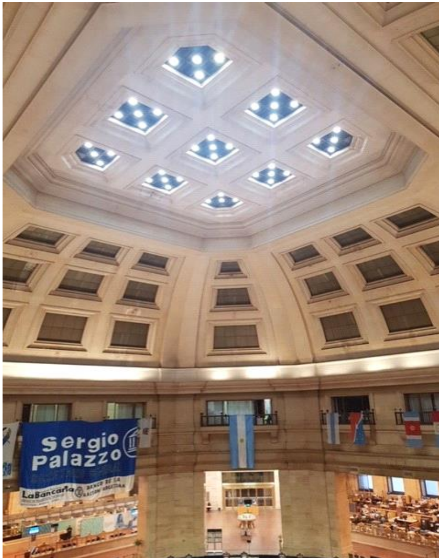
Bóveda espacio central, Planta Baja